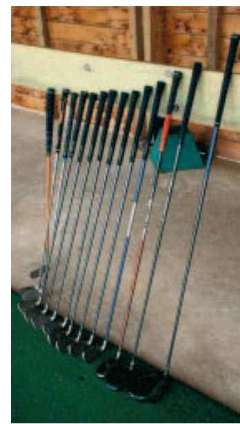
Le matériel se trouve d'occasion.