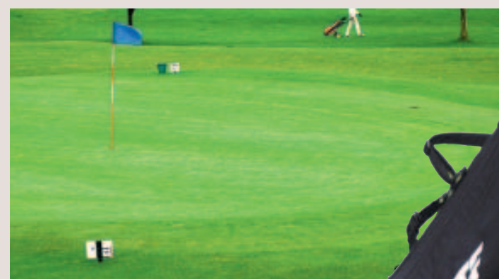
La Cup n'aura pas lieu à Avernas mais sur le 18 trous du Millennium.